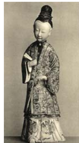
Ill. 7 Figur aus der Asiatika-Sammlung Walter Bondys/ Statue de la collection de l'art de l'Asie de Walter Bondy, Versteigerungskatalog/catalogue de vente, Berlin 1927, Tafel/planche XIX, Jüdisches Museum Wien