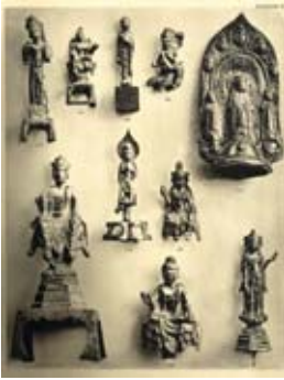
Ill. 16 Kleine chinesische Götterstatuen aus vergoldeter Bronze aus der Pariser Sammlung von/petites statuettes, en bronze doré, de la collection parisienne de Walter Bondy, Versteigerungskatalog/catalogue de vente, Paris 1928, Tafel/planche IV, Jüdisches Museum Wien