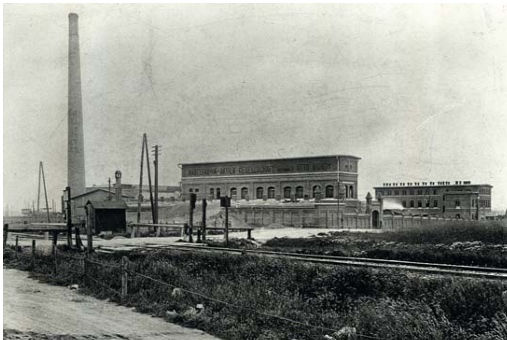
Ill. 4 Anonym/anonyme, Kabelfabrik Aktien Gesellschaft vormals Otto Bondy/câblerie SA jadis Otto Bondy , Wien-Meidling 1905, Bezirksmuseum Meidling, Wien/Vienne